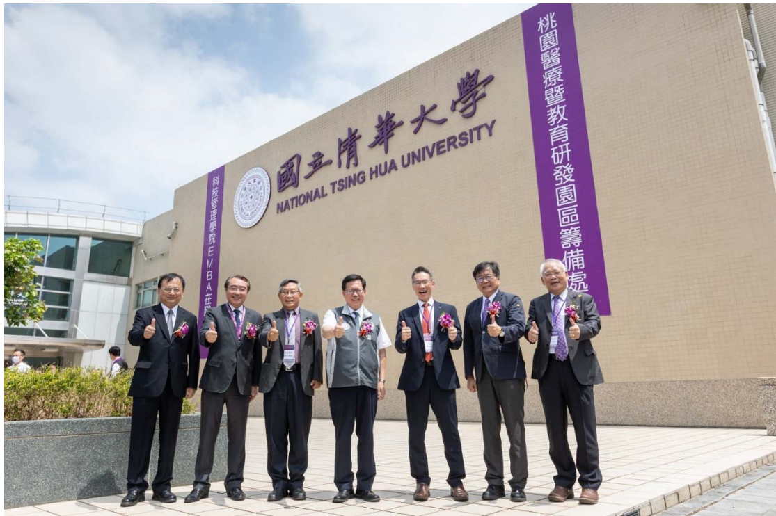
2022年8月20日，國立清華大學桃園醫院籌備處成立，右起戴念華副校長、呂平江副校長、高為元校長、桃園市鄭文燦市長、賀陳弘前校長、桃園捷運劉坤億董事長，及桃園航空城陳錫禎董事長揭牌。