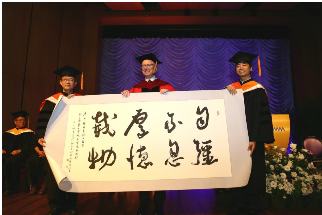
2014 年，清華頒贈名譽工學博士予 Irwin Jacobs 博士（中）。