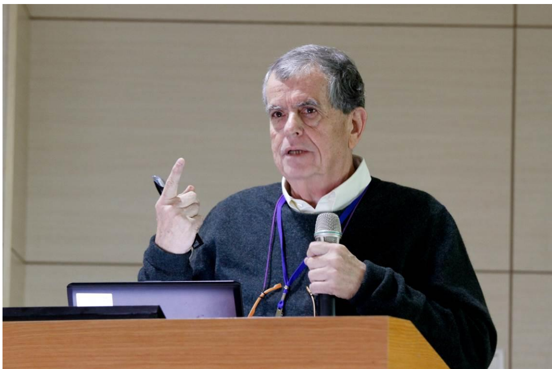
Prof. Aaron Ciechanover 在生命科學院B1華生廳演講。