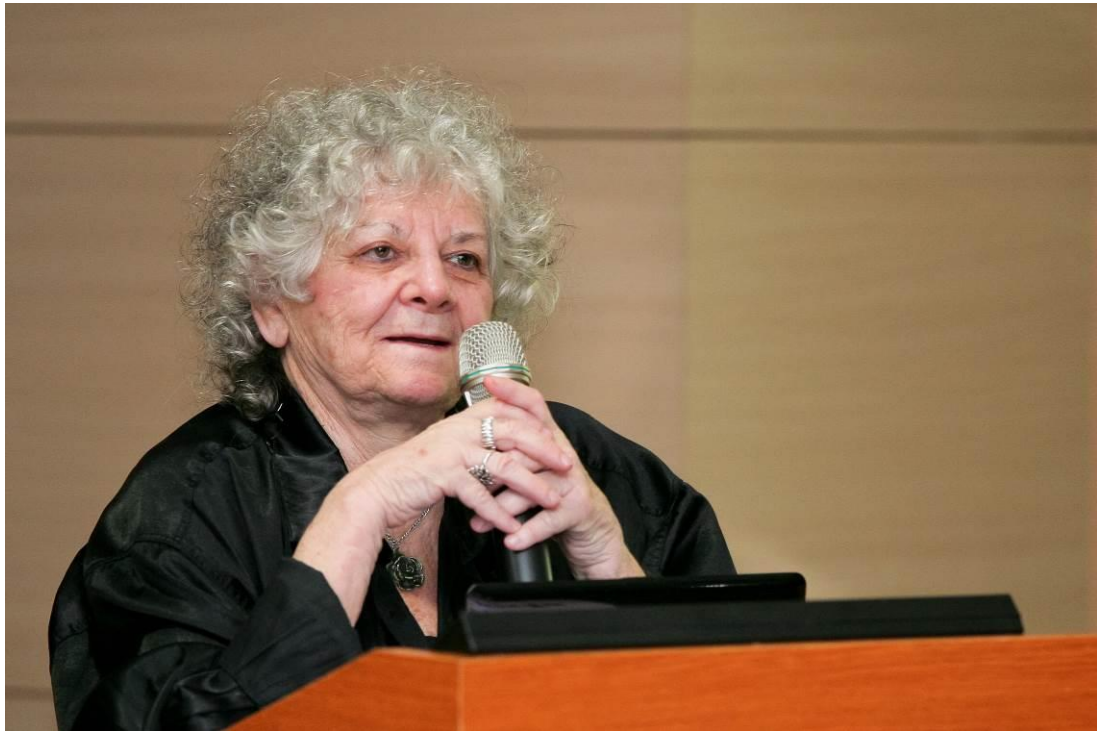
Prof. Ada E. Yonath 在生命科學院B1華生廳演講。