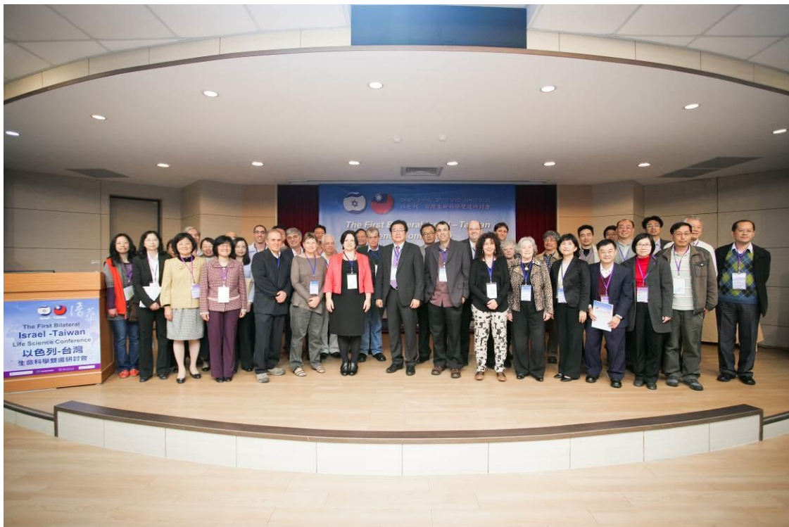
生命科學院教授與貴賓在B1華生廳合影。