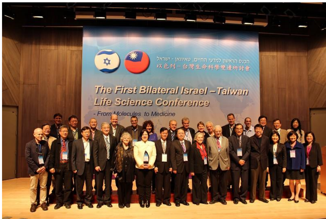
本校行政主管與貴賓在旺宏館國際會議廳合影。

24位學生一起參加研討會，密切交流以增進兩國年輕生命科學學者之間的了解與友誼。另外本校更安排了以色列學者進行參訪國內大學及座談會，與學生建立零距離的互動，作為未來共同舉辦研討會、學術合作及學生赴以色列發展之進一步交流的基礎，也落實以色列-台灣雙邊良好的學術國際交流關係，堪稱是2013年國內生命科學領域最大規模之研討會。