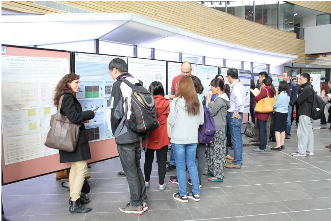
論文海報學術交流。